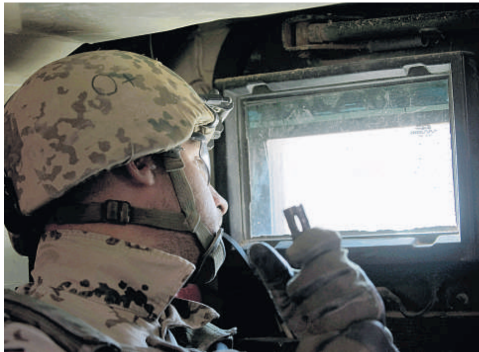
Der Krieg in Afghanistan holt viele Bundeswehr-Angehörige daheim wieder ein. Im Januar und Februar 2010 zählte der Sanitätsdienst 655 Fälle von traumatisierten Soldaten – mehr als je zuvor.

Im Krieg erleben Soldaten eine permanente Bedrohungssituation. Sie sehen, wie Kameraden schwer verletzt oder sogar getötet werden. Diese negativen Erlebnisse können ein Trauma auslösen, das die Betroffenen die nicht